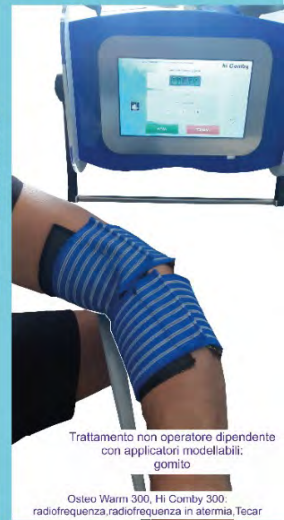
Trattamento non operatore dipendente con applicatori modellabili: gomito