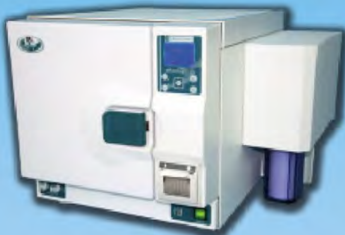
Phoenix Blu plus 18

La phoenix Blu plus+ è una versione speciale dell'autoclave phoenix Blu. L'autoclave è pronta per collegare il sistema di osmosi sul lato dell'autoclave, è comunque possibile po-sizionare il sistema di osmosi su una parete o mobili fino a 2 m. di distanza. L'autoclave verrà fornita con un depuratore ad osmosi.