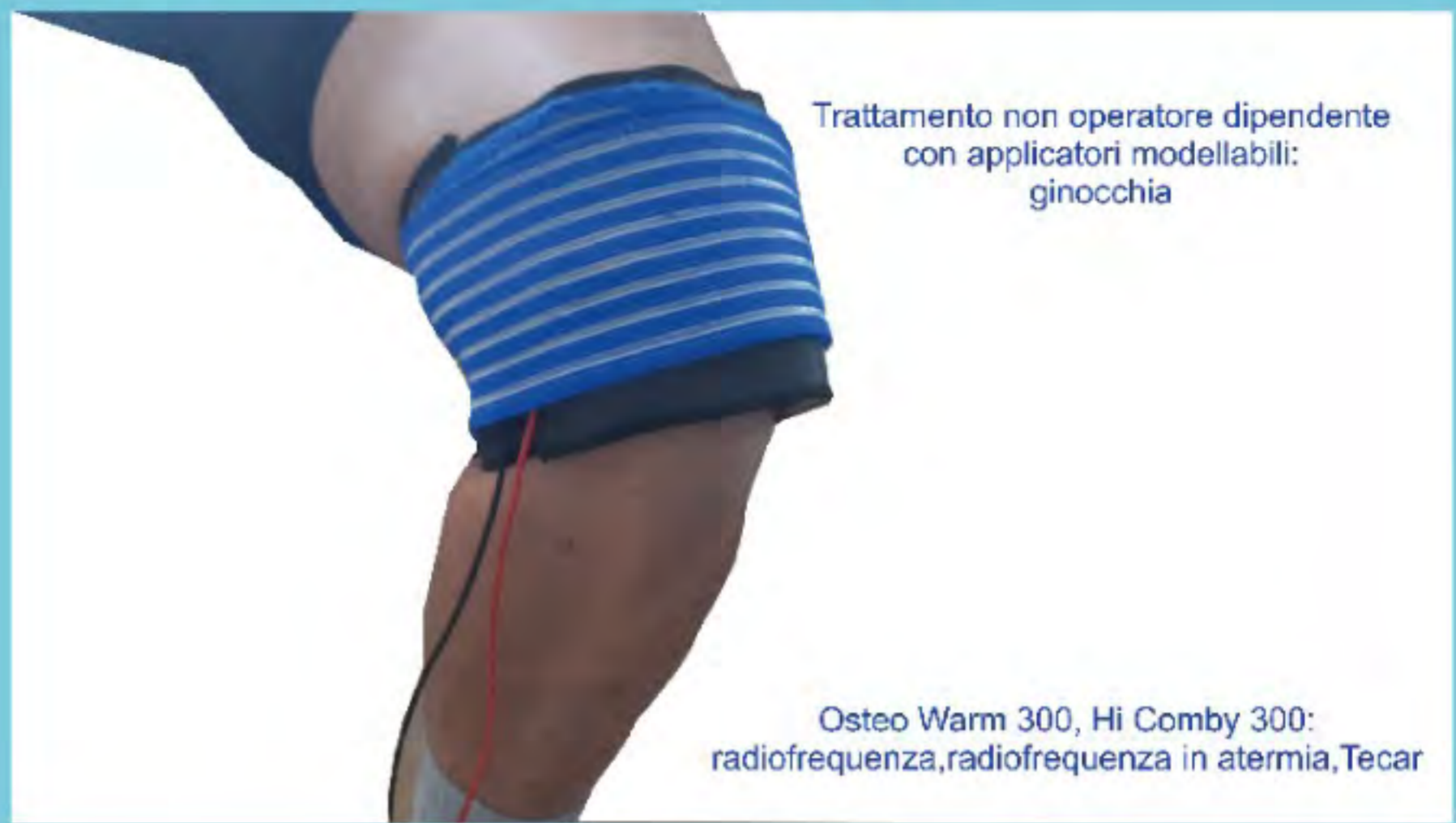
Trattamento non operatore dipendente con applicatori modellabili: ginocchia