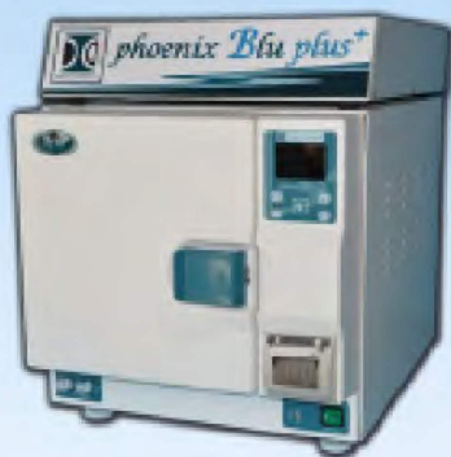
Phoenix Blu Top 18

a € 4.660,00 + iva e trasporto RATE PERSONALIZZATE