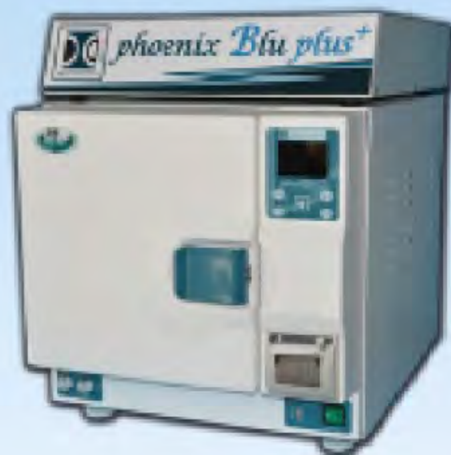
Phoenix Blu Top 24

a € 4.590,00 + iva e trasporto RATE PERSONALIZZATE