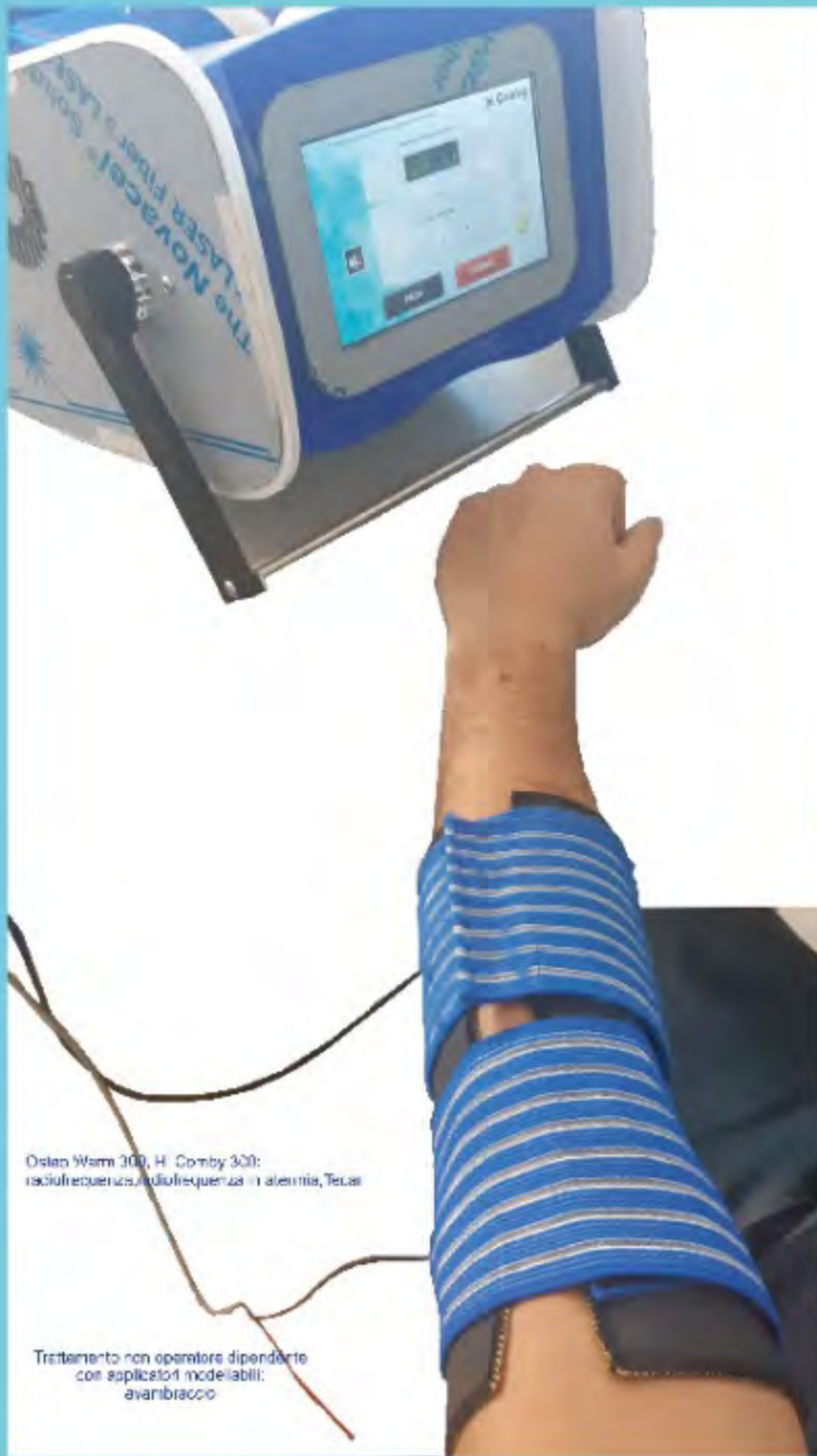
Osteo Warm 300, Hi Comby 300: radiofrequenza, radiofrequenza in atermia, Tecar