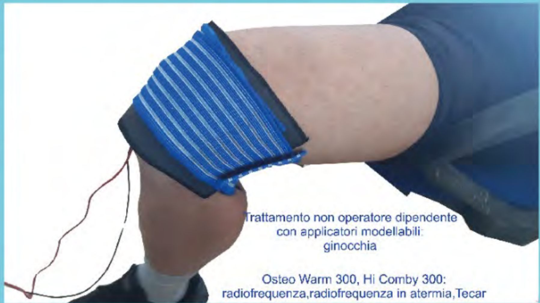
Trattamento non operatore dipendente con applicatori modellabili: ginocchia