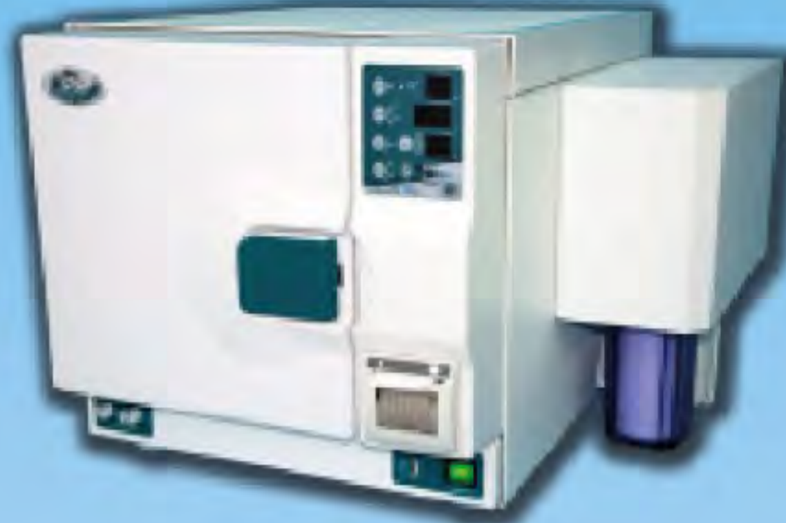
Phoenix Blu Led plus 18

a € 4.500,00 + iva e trasporto RATE PERSONALIZZATE